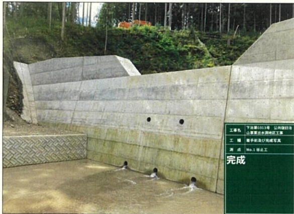
谷止工正面より望む