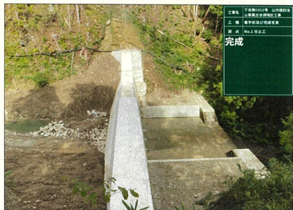
谷止工側面より望む